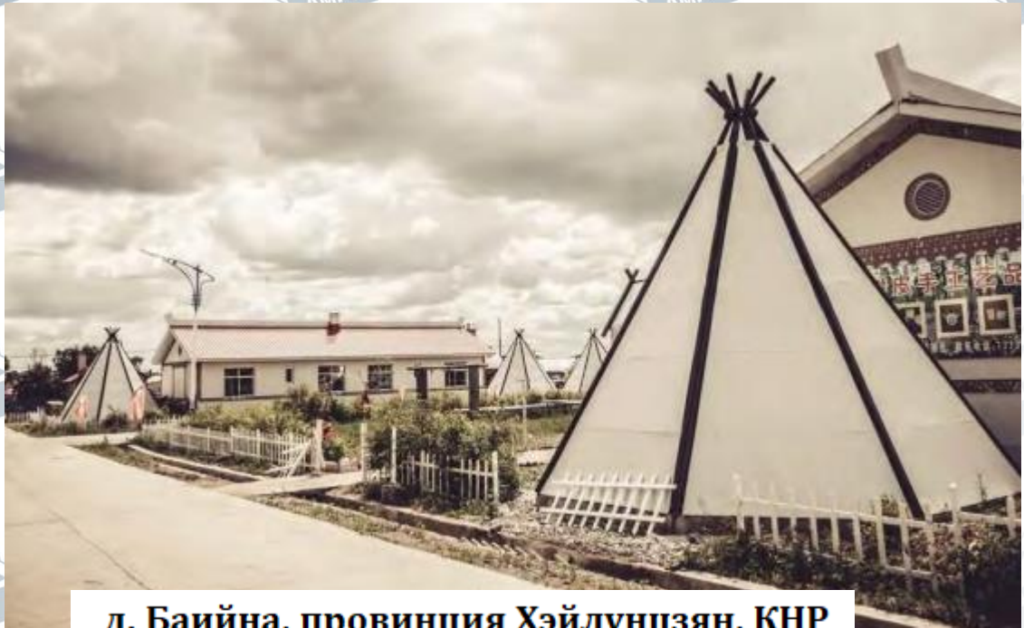
д. Байна, провинция Хэйлунцзян, КНР 70 лет оседлой орончонской жизни